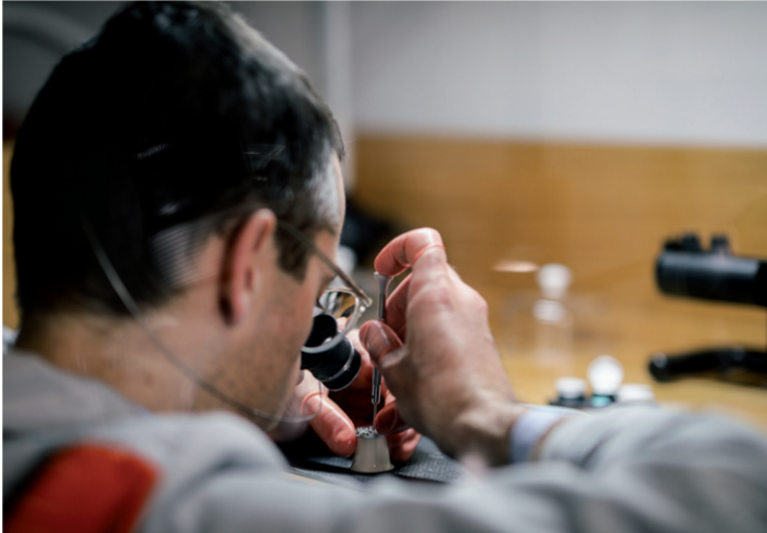
Uhrmacher bei der Arbeit im Geschäft Uhrensachen in Bern.